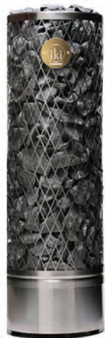
Pillar IKI 7,5 кВт