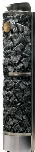
Wall IKI 6 кВт