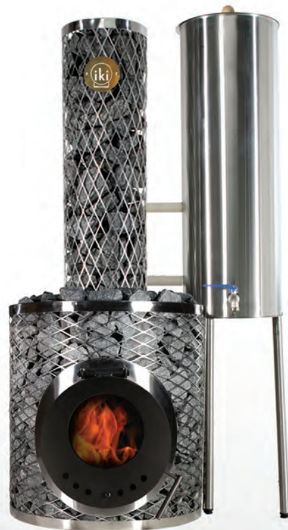
Original IKI Plus