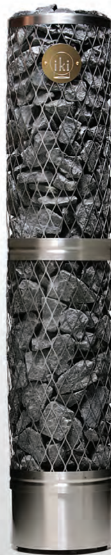
Pillar IKI 6 кВт

Электрические печи для сауны IKI можно дополнить защитным кольцом. С ним можно встроить печку прямо в пол или лавки.