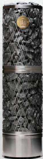
Pillar IKI 9 кВт