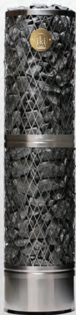
Pillar IKI 12 кВт