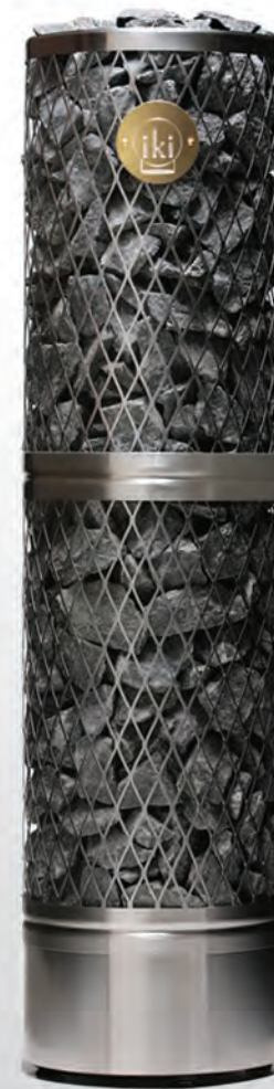
Pillar IKI 10 кВт