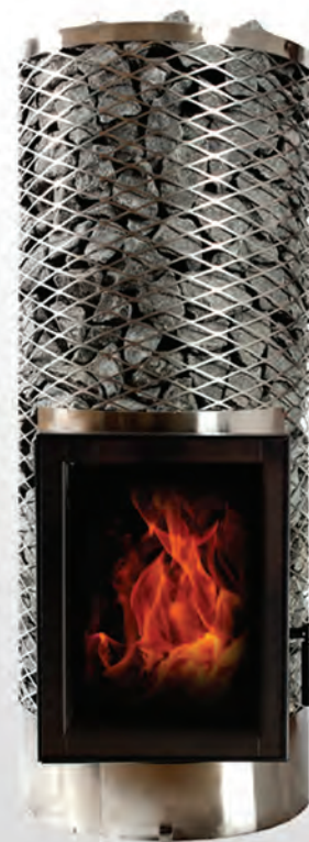
KIVI IKI jr

Печь проста в использовании и достаточно вместительна, чтобы использовать поленья до полуметра длиной. Труба дымохода закручивается петлёй под камнями. Это делает печи IKI KIVI одними из самых эффективных по теплоотдаче.