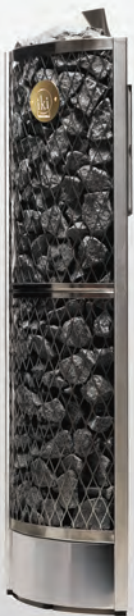
Corner IKI 6 кВт